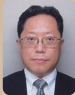
板倉 康洋 (いたくら やすひろ)

文部科学省科学技術・学術政策局 局長 1987年京都大理学部卒。同年科学技術庁入庁。 東京農工大教授、文部科学省研究振興局ライフサイエンス課長、日本医療研究開発機構経営企画部長、文部科学省大臣官房審議官等を経て、2020年7月から現職。