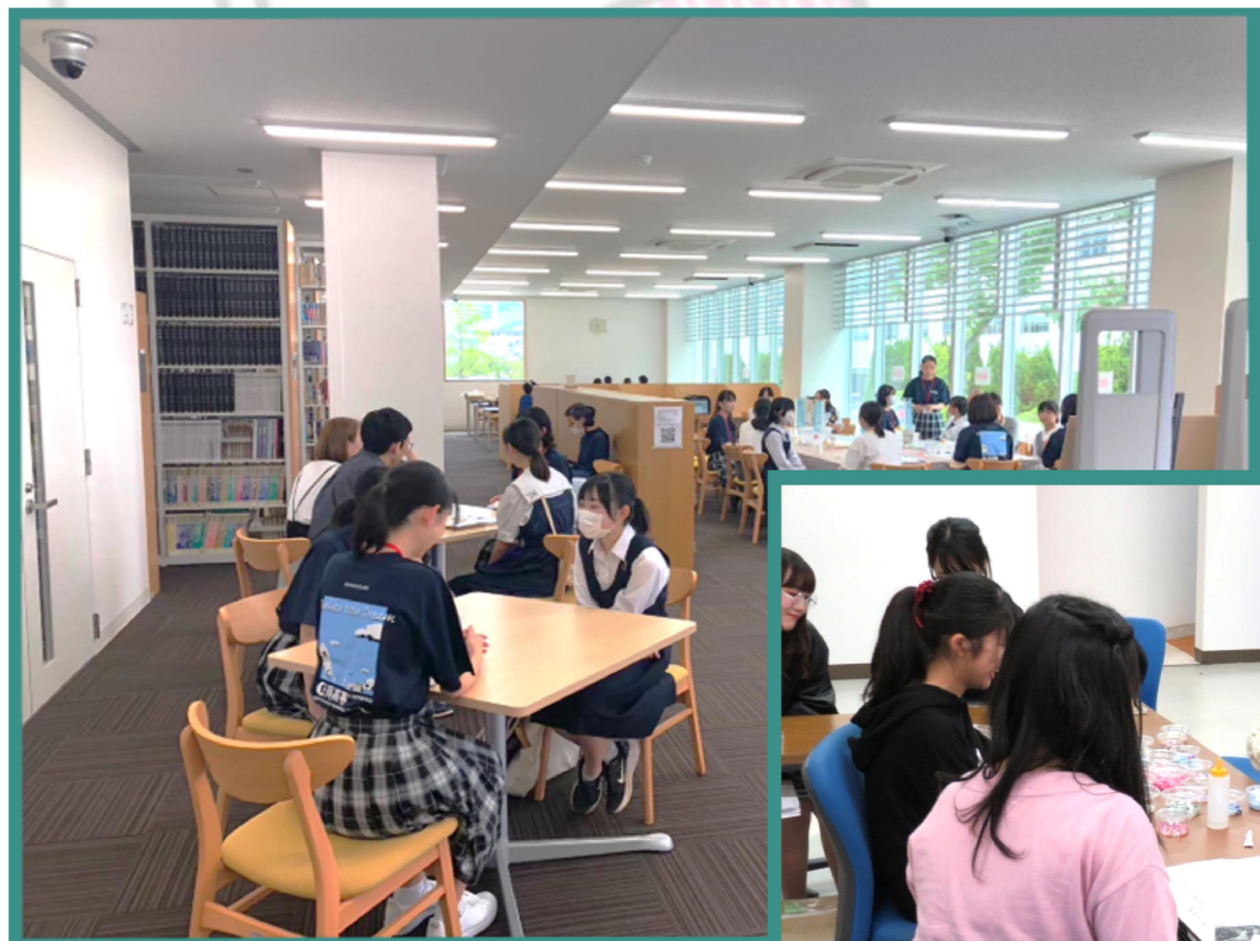
↑ 女子中学生向け 高専入学相談会のようす →